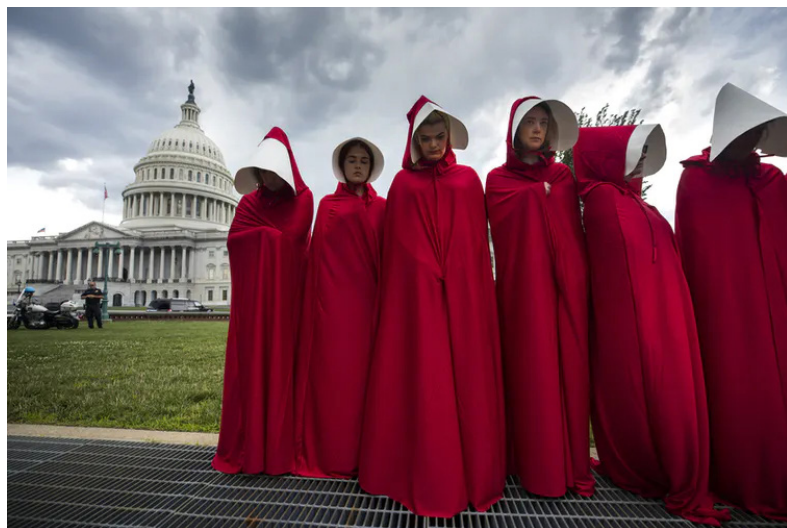
Activists in the US have donned the red cloaks imagined by Margaret Atwood in The Handmaid's Tale

Porque ese es otro de los problemas de la relación de la serie con la realidad. Tras su emisión se pusieron de moda protestas en las que las mujeres iban vestidas como las criadas. Así ocurrió, por ejemplo, en mayo del 2017, cuando un grupo de activistas pro-choice protestaron, contra una ley aprobada en el estado de Texas, vistiendo togas rojas y tocados blancos. Quien niegue que el aborto es un tema complejo es, probablemente, un dogmático. Yo soy provida por razones antropológicas, biológicas, sociales y médicas, pero no se me escapa la complejidad insalvable de un tema donde hay una colisión de dos derechos. Aun así, buscar paralelismos entre la pesadilla de Gilead y un asunto debatible como el aborto —que dista mucho de estar cerrado en USA— es, de nuevo, de una deshonestidad que entristece.