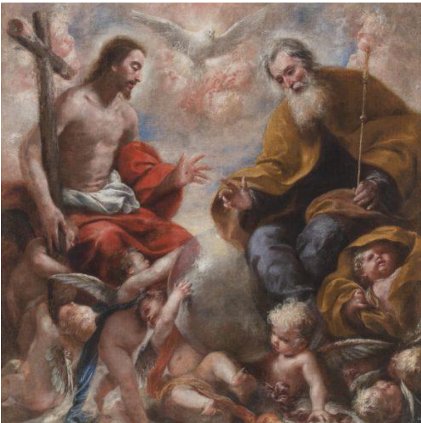
santisima trinidad fondo

No has mentido a los hombres sino a Dios” [Hechos 5: 3-4].