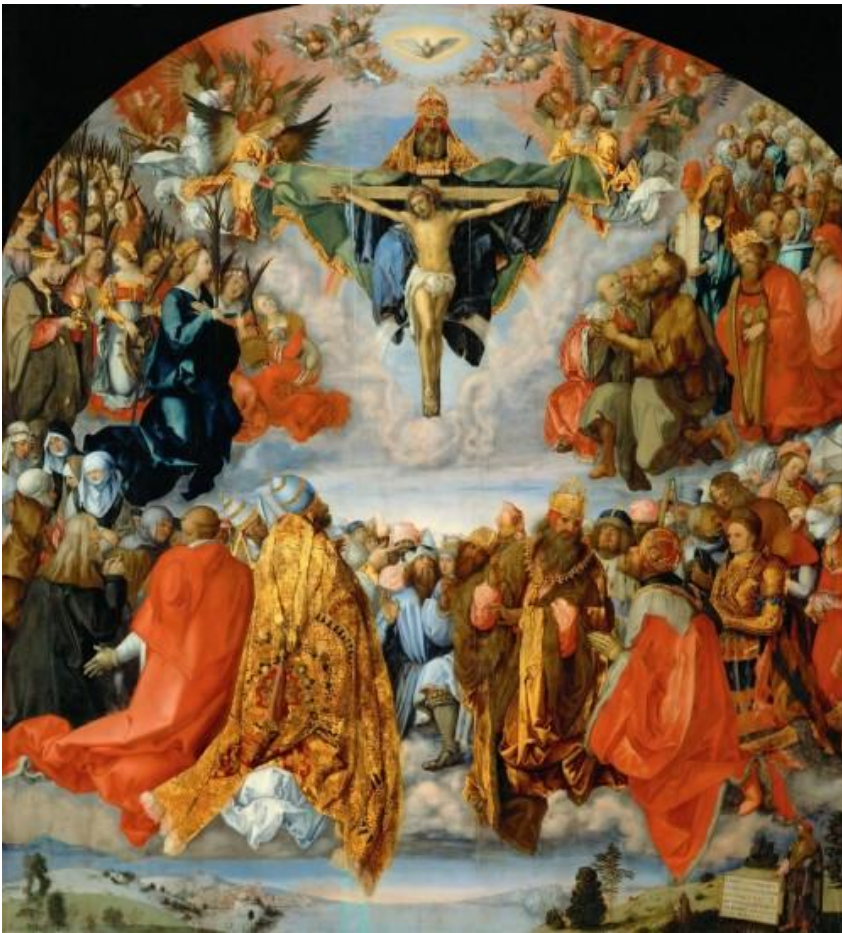
Durero santísima trinidad

La Iglesia enseña que la Santísima Trinidad es el misterio central de la fe cristiana. Pero, ¿cuánto sabes acerca de este misterio? ¿Cuál es su historia?